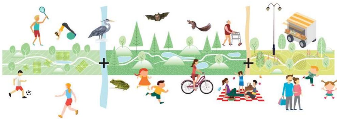
Het Hondsrugpark biedt ruimte voor activiteiten, rust, en ontmoeting

De zone aan de kant van de IKEA is juist gericht op ontmoeting, met verblijfplekken, pleintjes en zitmogelijkheden. In de gebouwen direct aan het park komen horecavoorzieningen. Delen van het park kunnen gebruikt worden voor terrassen, waardoor er overdag een gezellige ontspannen sfeer hangt."